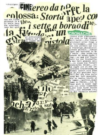
Rolf Dieter Brinkmann: Schnitte (ca. 1972/73). © Rowohlt 1988, copertina originale e pp. 58 e 59.

La sua famosa raccolta Westwärts 1&2 (« Verso Occidente 1&2 ») è forse il migliore esempio di questi scopi, ironizzando già nel titolo il mito del 'Far West' e del progresso perpetuato. La raccolta, apparsa nel 1975, poche settimane dopo la morte di Brinkmann, è forse il suo libro più maturato e influente, una Recherche in versi. 5 Da questo volume è tratta la poesia Roma la notte (da leggere anche come poesia d'amore alla moglie Maleen). Contrariamente a molte altre antologie (italiane ed estere) abbiamo voluto scegliere una delle forme lunghe, molto caratteristiche per l'ultimo Brinkmann, perché parte integrale del programma poetico.